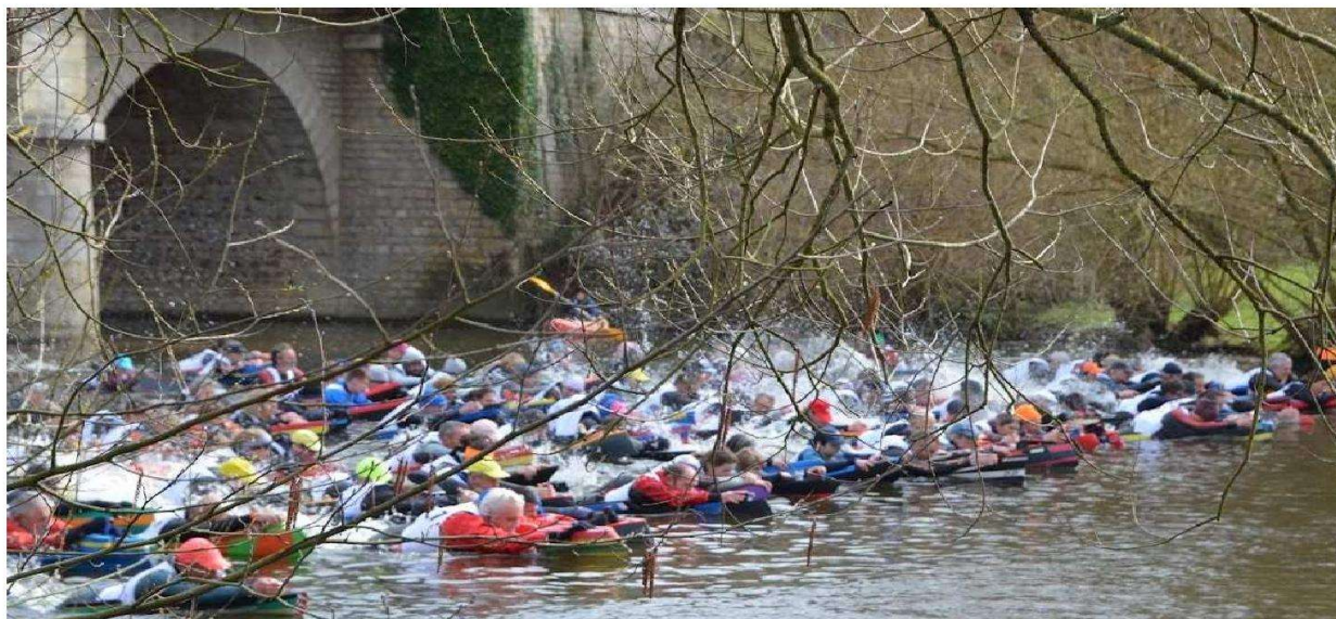
Descente du Loir 2023 - Châteaudun: